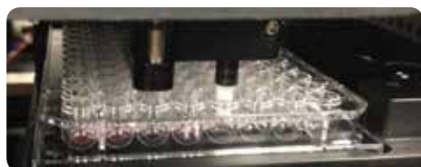
ミキサーパドルが各ウェルを測定前に攪拌している様子