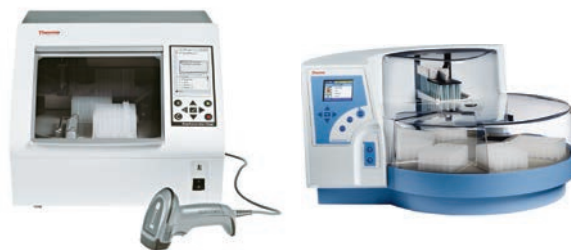
KingFisher Duo Prime