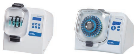
Bead Mill 4