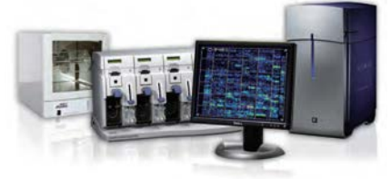
Applied Biosystems™ GeneChip™ Scanner 3000 G7 Thermo Fisher Scientific