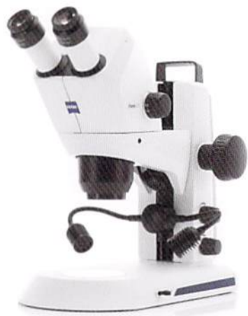
ZEISS Stemi 305 cam