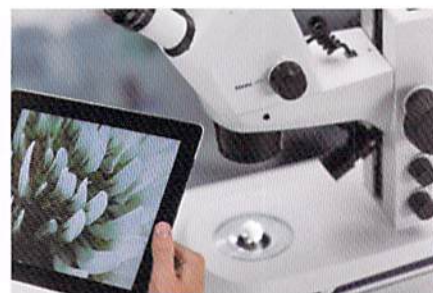
簡単操作のLabscopeは無償でインストール可能。