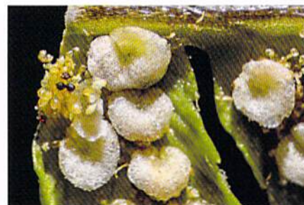
シダの孢子 ダブルアームLED