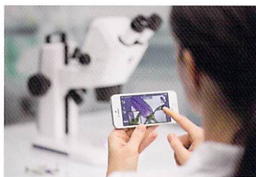
iPad、iPhone、Windows PCに対応のLabscopeを使ってライブ表示や画像取得が可能。

120万画素Wi-Fiカメラ内蔵のStemi 305 camを特別価格にて提供いたします。