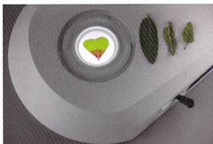
明視野と暗視野の切替えが可能な透過光ユニット