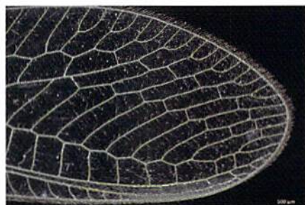
昆虫のミドリクサカゲロウ 透過暗視野