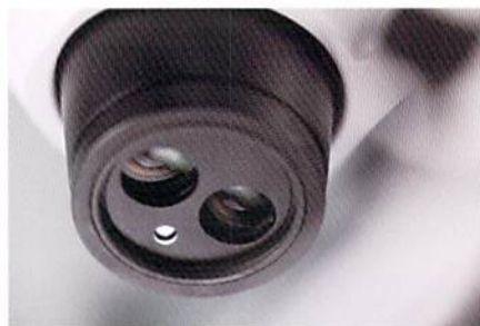
本体に内蔵同軸（ニアパーチカル）照明