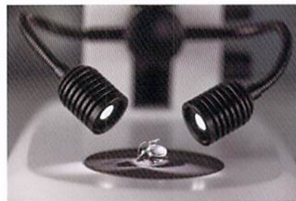
サンプル作製に最適なダブルアームLED照明