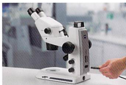
余分なアクセサリボックスやケーブルは一切不要。