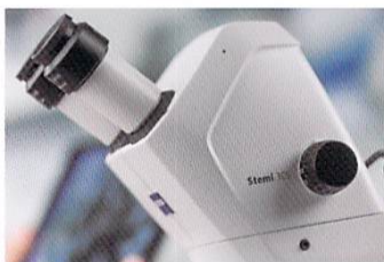
本体に高速カラーWi-FiカメラとWLANルーターを内蔵。