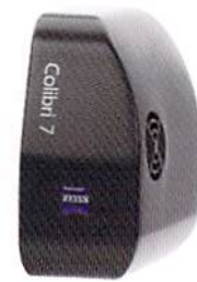
ZEISS Colibri 7

倒立顕微鏡 Axio Vert.A1と4K出力対応のPCレスデジタルカメラ Axiocam 208 colorのスマートパッケージでルーチンワークの効率改善をサポートします。