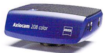
ZEISS Axiocam 208 color