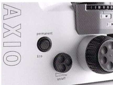
一定時間使用しないとスタンバイになるEcoモードを標準搭載