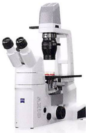
ZEISS Axio Vert.A1位相差仕様 (左)、LED蛍光仕様 (右)、仕様は変更可能