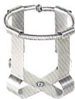
メディアボトル クランプ