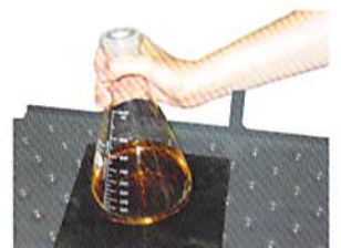
スティッキーパッド