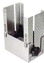
マイクロプレートラック (積み重ね)