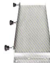
マイクロプレートラック (平置き)