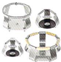
エrlenマイヤー フラスコクランプ

製品の仕様、価格、外観等は予告なしに変更することがあります。希望小売価格は2021年1月現在の価格です。希望小売価格およびキャンペーン価格に消費税は含まれておりません。