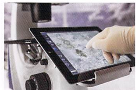
Primovert HDcamはフロントホルダーに iPad等のモニターの設置が可能。