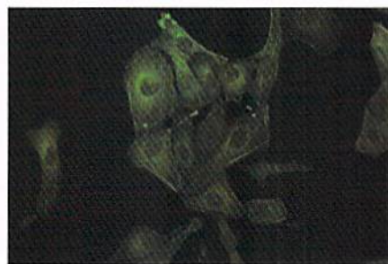
U2OS細胞、GFP標識アクチン、倍率20x