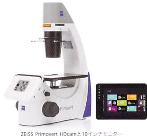
ZEISS Primovert HDcamと10インチモニター

機能とデザインで好評をいただいているルーチン倒立顕微鏡Primovertシリーズを特別価格にて提供いたします。ラボのルーチンワークにZEISSの顕微鏡を導入してみませんか。