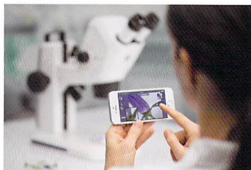
iPad、iPhone、Windows PCに対応のLabscopeを使ってライブ表示や画像取得が可能。

120万画素Wi-Fiカメラ内蔵のStemi 305 camを特別価格にて提供いたします。