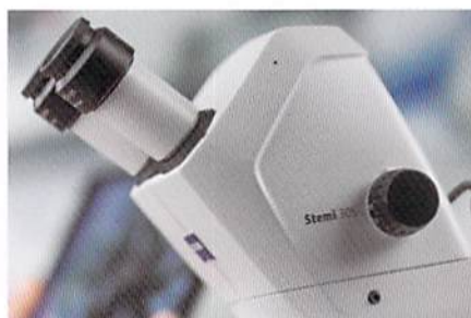
本体に高速カラーWi-FiカメラとWLANルーターを内蔵。