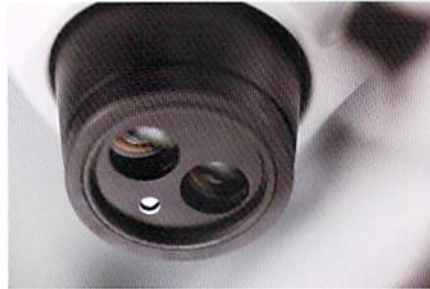
本体内蔵同軸（ニアバーチカル）照明