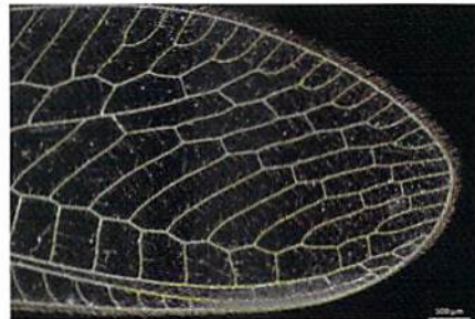
昆虫のミドリクサカゲロウ 透過暗視野