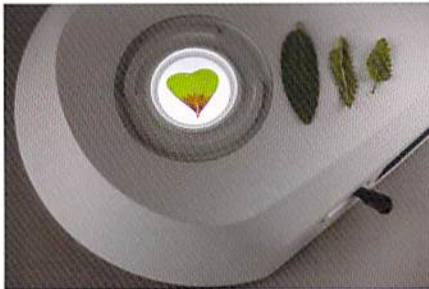
明視野と暗視野の切替えが可能な透過光ユニット