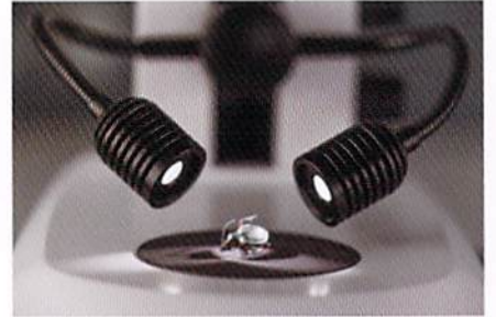
サンプル作製に最適なダブルアームLED照明