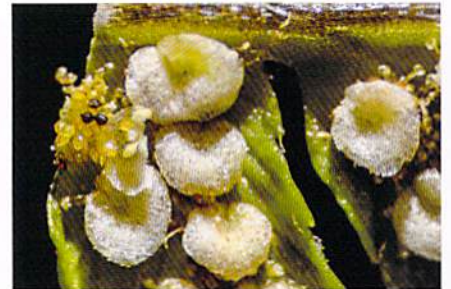
シダの胞子 ダブルアームLED