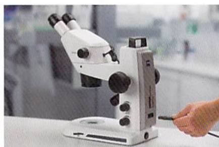
余分なアクセサリボックスやケーブルは一切不要。