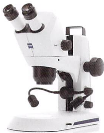
ZEISS Stemi 305 cam