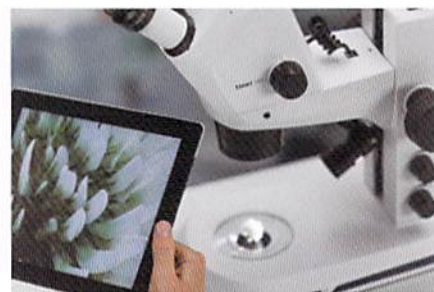
簡単操作のLabscopeは無償でインストール可能。