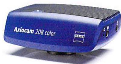
ZEISS Axiocam 208 color