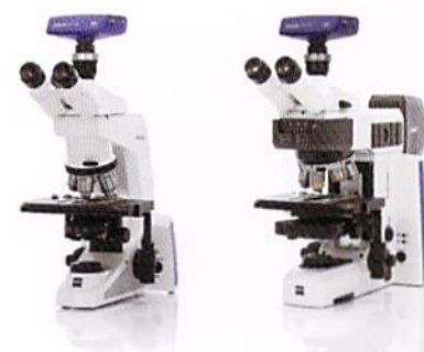
Axiolab 5(左)、Axioscope 5(右)との組み合わせ例