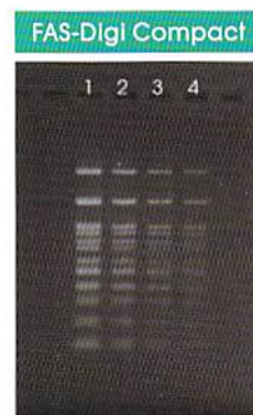
F=8, Exposure 0.5 sec, ISO=100

FAS-Digi Compactで撮影した画像は、他の2機種の写真と比較して、遜色の無いものであった。