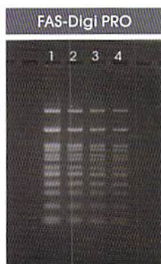
F=8, Exposure 0.5 sec, ISO=100