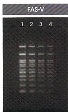
F=8, Exposure 0.5 sec, Gain=0, Gamma=1.0