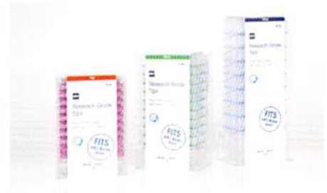
リサーチグレード 詰め替えチップ