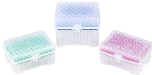
リサーチグレード ラック入りチップ