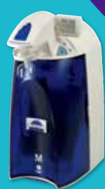
'12 Synergy UV