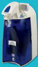
Direct-Q UV 3