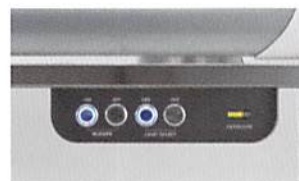
コントロールパネル

作業エリアは耐蝕性の高いステンレス鋼(SUS304)を採用しています。流し部はドレンが付属しており、洗浄・薬液消毒を容易に行うことができます。また、HEPAフィルターの目詰まり状況を確認できるLEDバーを搭載しております。