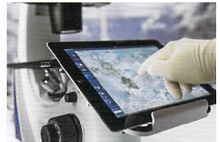
Primovert HDcamはフロントホルダーに iPad等のモニターを設置可能。