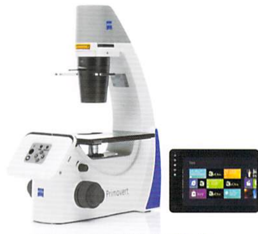
ZEISS Primovert HDcamと10インチモニター

機能とデザインで好評をいただいているルーチン倒立顕微鏡Primovertシリーズを特別価格にて提供いたします。ラボのルーチンワークにZEISSの顕微鏡を導入してみませんか。