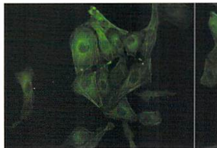
U2OS細胞、GFP標識アクチン、倍率20x