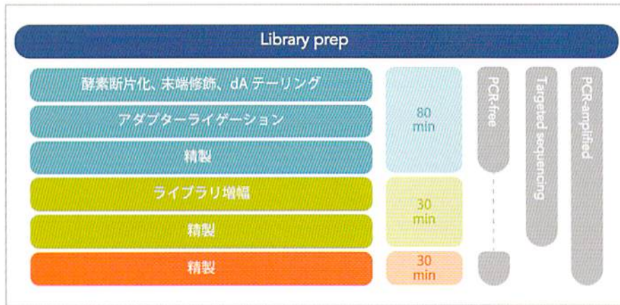
図1. Lotus DNAライブラリ調製の概要