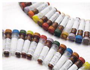
フローサイトメーター用 抗体試薬