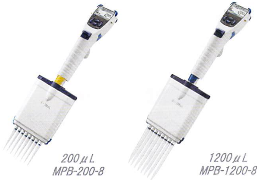
200 \mu L MPB-200-8