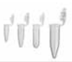
核酸低吸着性 チューブ