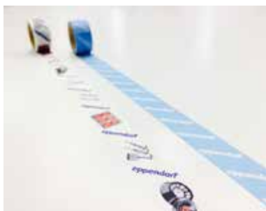
マスキングテープ

さらに、ご参加いただいた方の中から抽選で毎月3名様には、 エッペンドルフオリジナルTシャツ をプレゼント！！