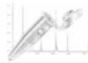
タンパク質 低吸着性チューブ