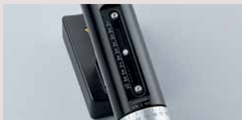
スケールの位置によって操作感を自分で調整可能