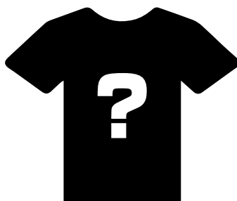
オリジナルTシャツ