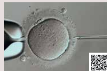
アプリケーション資料 (QRコード)