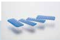
分割可能な PCRプレート