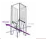
ディスポーザブル キュベット