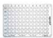
核酸低吸着性 PCRプレート